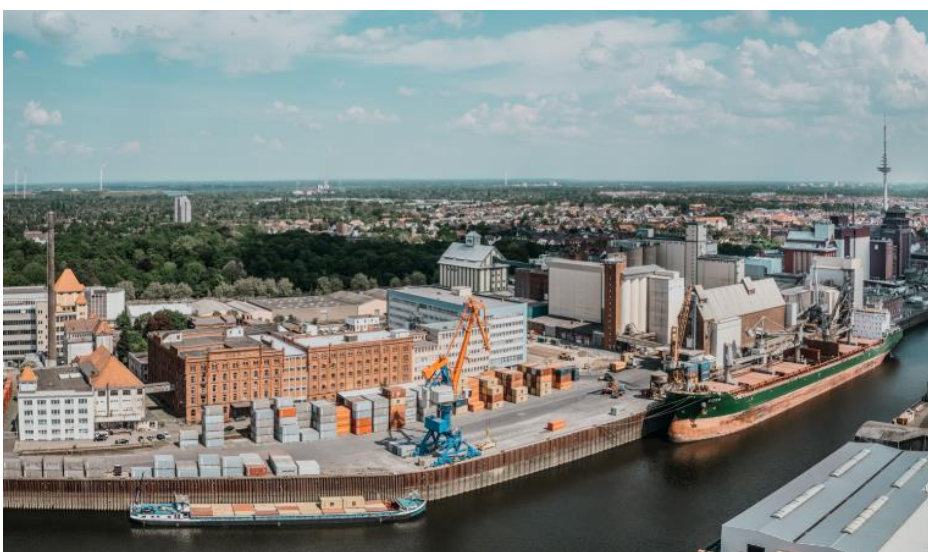
J. MÜLLER Weser in Bremen, Kaffeeterminal und Terminal für Maritime Proteine [Krill- und Fischmehl], Cuxhavener Straße