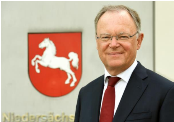
Stephan Weil, Niedersächsischer Ministerpräsident [ Fotomaterial Download und Quellenangabe ]