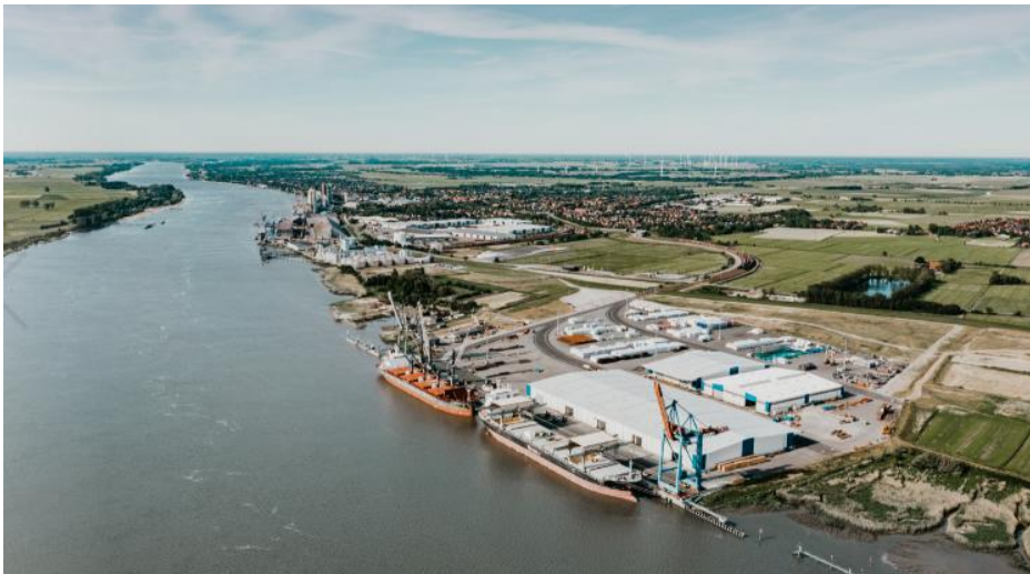
J. MÜLLER Weser in Brake, Schwerlastterminal Niedersachsenkai