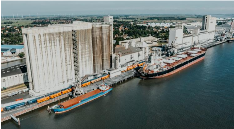
J. MÜLLER Weser in Brake, Althafen